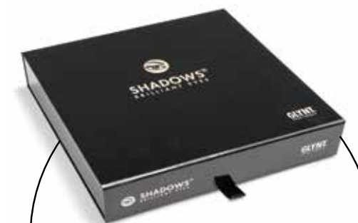
Le coffret SHADOWS BRILLIANT EYES® professionnalise la coloration en salon.

Pour que le service « COLORATION DES CILS ET DES SOURCILS » avec SHADOWS BRILLIANT EYES® soit un succès total dans votre salon, nous vous fournissons des supports publicitaires pour vous aider.