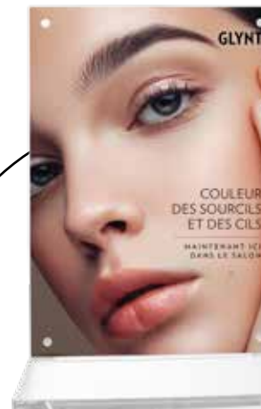
L'INSERT POUR PRÉSENTOIR ACRYLIQUE attire l'attention sur le service dès l'entrée dans le salon.

NOUS VOUS SOUTENONS AVEC UN MATÉRIEL PUBLICITAIRE ATTRACTIF POUR COMMUNIQUER